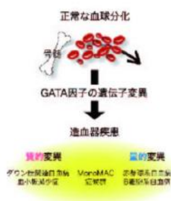
Figure 1 GATA因子の機能破綻が関与する血液疾患

さらに、GATA 因子が、腎臓の機能低下による貧血や慢性炎症性貧血の新しい治療標的分子となり得ること、がん細胞の生存に重要であることが分かってきました。そこで、GATA 因子の機能を制御する低分子化合物を開発することで、新しい貧血治療薬や制がん剤を創出できると考え、研究を進めています。