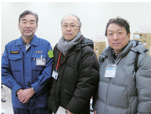
図4 石巻市役所内仮設診療所への薬の配布（3月21日）

そこで、てんかん学分野では、日本てんかん協会や日本てんかん学会と連携した上で、患者の不安を取り除く活動を展開した。NHK ラジオ第一放送宮城のニュース番組への出演、NHK ラジオ第二放送の全国放送、エフエム仙台を通じた毎週月曜朝の10分間の番組「知って安心、身近な病気てんかん（6月～8月）」、市民講演会（8月27日）などである。また日本てんかん協会宮城県支部が設置した相談電話や、静岡てんかんセンター内に設置されたホットラインの活動に関しても、連携した活動を行っている。さらに、ツイッターやフェイスブック