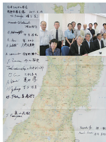
図5 日本てんかん学会復興対策会議（6月19日）

てんかん診療の理想は、地域のプライマリ・ケア医と、高度な設備をもつ包括的てんかんセンターとの連携医療にある。もともと東北地方は、てんかん診療においては発展途上地域であった。今回の震災で東北地方沿岸部は、あまりに残酷な被害を受けた。しかし、東日本大震災の「禍を転じて福」とすべく、てんかん学分野では理想的な地域医療システムの構築に向け、活動を展開したいと考えている。