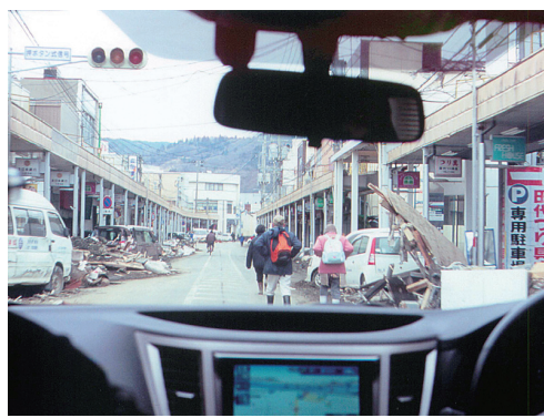
図3 石巻への抗てんかん薬の配布(3月21日)