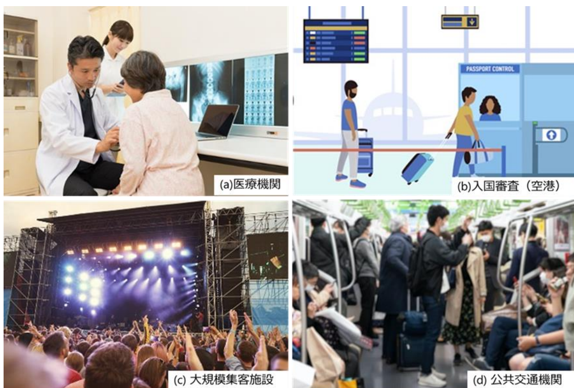
図1 ウイルスセンサ・検査法が感染症対策の課題となる環境の例

会話や咳によって環境空气中に放出されたエアロゾルは毎秒数十 cm という高速で空間を移動します。センサが 1m 以内の距離にあれば、エアロゾルは 10 秒以内にセンサに到達して、エアロゾル中のウイルスは水を被った状態でセンサ表面に保持されると考えられます。そこでボールウェーブはその固有技術であるボール SAW センサ 注2 の表面に抗体またはアプタマーを固定し、保持されたウイルスのスパイク蛋白と反応させてウイルスを捕捉するセンサを考案しました(図2)。このセンサの応答時間は 10 秒以下であり、ウイルスが微量でセンサ応答が小さくてもボール SAW センサの画期的な原理によって応答が増幅されるので、高感度に検出できると期待されます。豊田合成が車の内外装部品の開発で培った表面処理技術と、東北大学の呼気中のウイルスや炎症性蛋白を質量分析で検出する高精度な診断法である呼気オミックス 注3 の知見を総合して、共同開発を進めます。