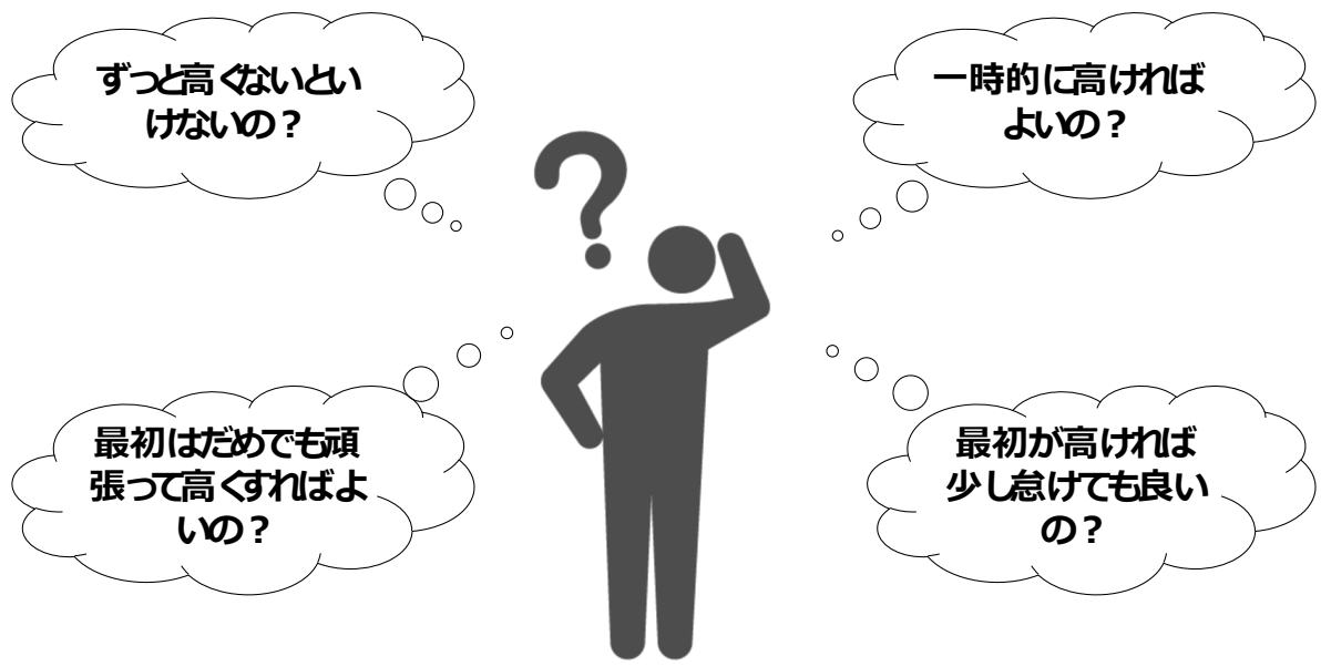
図 1. 本研究で解決する疑問