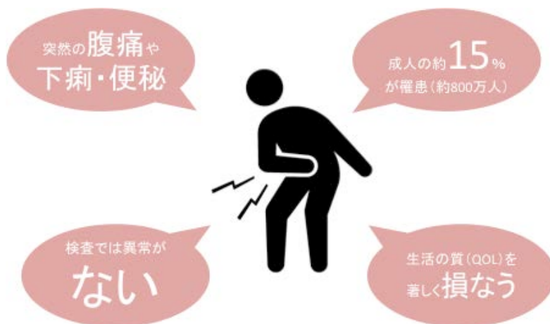
図 1.過敏性腸症候群