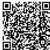
↑こちらの QR コードから アクセスできます。