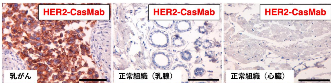
図1. HER2-CasMabは正常細胞には全く反応しない(免疫組織染色)

なお、Fate Therapeutics社(米国カリフォルニア州サンディエゴ)は、令和6年1月8日に、HER2-CasMabの遺伝子を導入した多重遺伝子編集キメラ抗原受容体(CAR)T細胞製品候補であるFT825/ONO-8250の第I相臨床試験において、患者登録を開始したことを発表しています( https://www.med.tohoku.ac.jp/5561/ )。