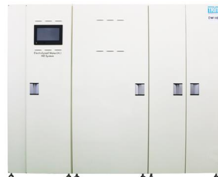
【ご参考】電解水透析 ※ システム「EW-HDシステム」

※5 電解水透析 ※ とは、水の電気分解により陰極側に生じた、水素を含有した透析用水を利用して行なう透析療法