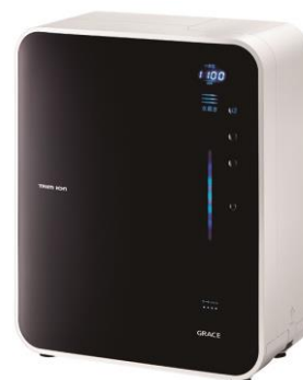
【ご参考】電解水素水整水器「TRIM ION GRACE」

末期腎不全患者のための電解水透析 ※5 システムは、血液透析液を調製するための希釈水を水道水から作る水処理装置内に電解槽を組み込み、水素分子(H 2 )を含む血液透析液を調製して透析患者へ供給できます。東北大学をはじめとした研究機関との産学官連携により開発されたこのシステムは、通常の血液透析システムの水処理装置と同じ使い方で、安全に且つ長期的に継続使用できます。