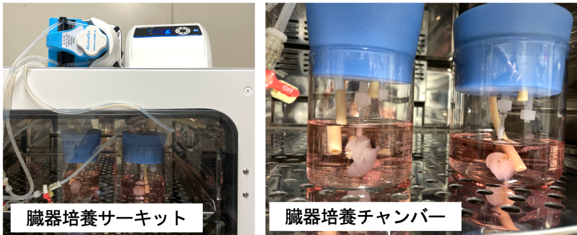
図 2. 肺再生用還流培養装置