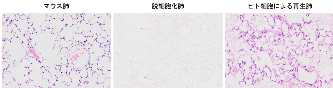
図 3 脱細胞化・再細胞化法による肺血管網の再生