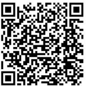
↑こちらの QR コードからアクセスできます。